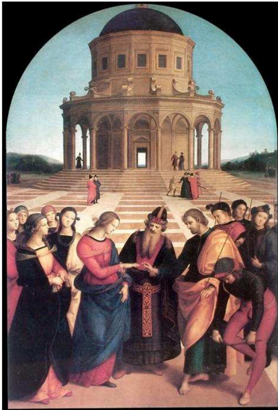
Raphaël, Il Sposalizio (Le mariage de la Vierge) 1504